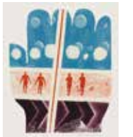
てのひらの物語(1972年)