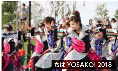
ちば YOSAKOI 2018

いちはら最大級の祭典、上総いちはら国府祭りを開催します。二日間にわたって、子どもから大人まで楽しめるイベントが盛りだくさん。家族や友人と一緒に祭りを楽しみましょう。