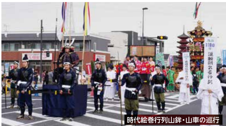
時代絵巻行列山鉾・山車の巡行