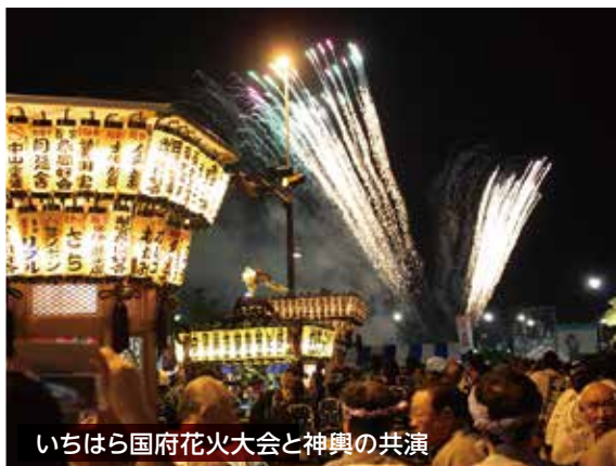
いちはら国府花火大会と神輿の共演