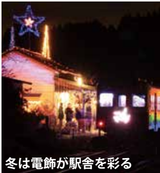
冬は電飾が駅舎を彩る