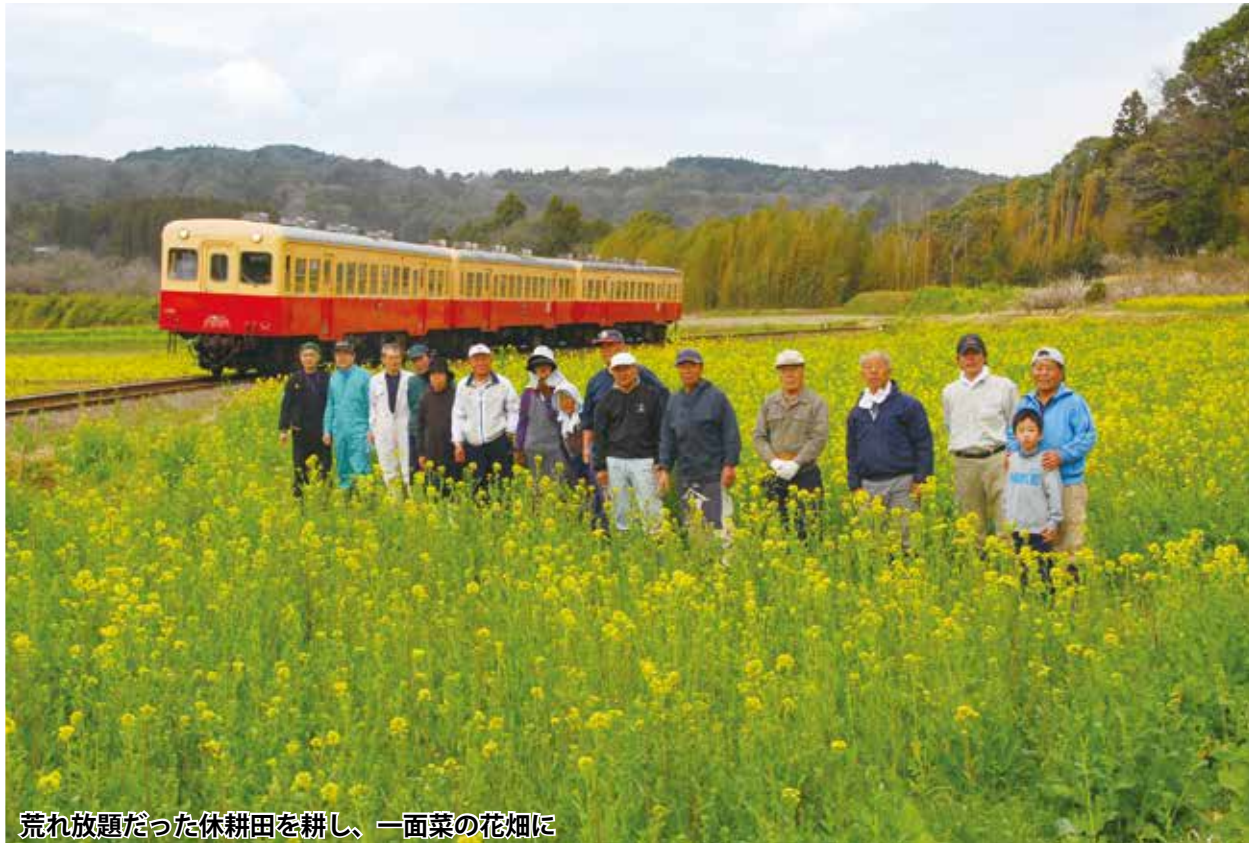
荒れ放題だった休耕田を耕し、一面菜の花畑に