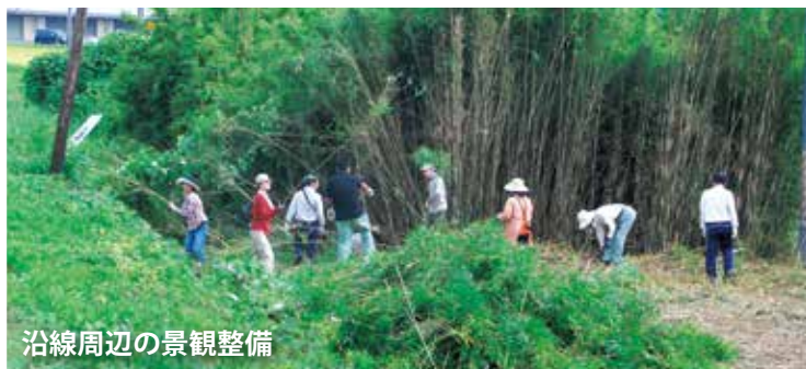
沿線周辺の景観整備