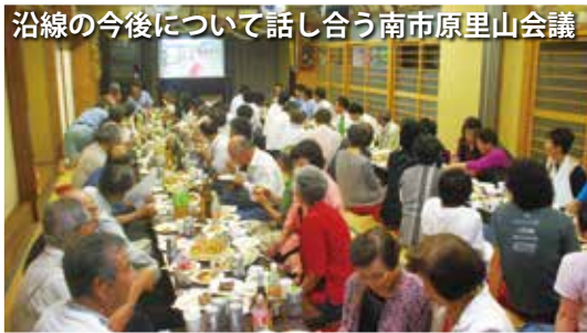
沿線の今後について話し合う南市原里山会議