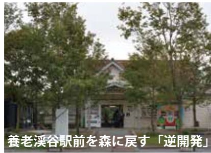
養老溪谷駅前を森に戻す「逆開発」