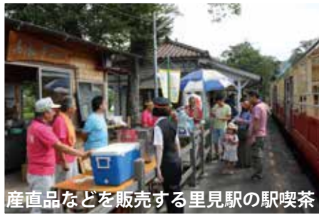
産直品などを販売する里見駅の駅喫茶