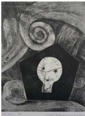
眠りの前 (深沢幸雄・1955 年作)