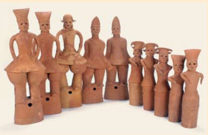
市指定文化財、山倉 1 号墳出土埴輪

資料です。 展示場所 山倉 1 号墳出土埴輪は、平成 24 年 12 月 27 日に市の指定文化財となりました。 主要な埴輪は、国立歴史民俗博物館(佐倉市)の常設展示室で見ることが出来ます。 問合せ Web ふるさと文化課 ☎ 9853