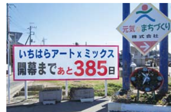
南いちはら応援団、大きな看板でPR(牛久)