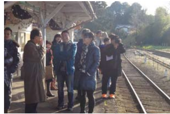
見学会では小湊鐵道の駅舎なども視察

1月21日から2月4日まで作品プランを受け付けたいこと、日本人作家92点、外国人作家9点、計101点の応募がありました。提案作品には、『いちはらアート×ミックス』の展開プロジェクトである空き家・校舎を活用した作品や里山などの自然を活用した作品、食をテーマにした作品など、多種多様な提案がありました。