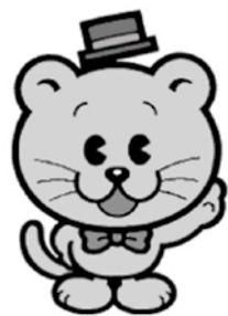
千葉県明るい選挙シンボルキャラクター『せんきょ君』

千葉県知事選挙が、2月28日(木)に告示され、3月17日(日)に投票が行われます。あなたの一票を無駄にしないよう、必ず投票しましょう。