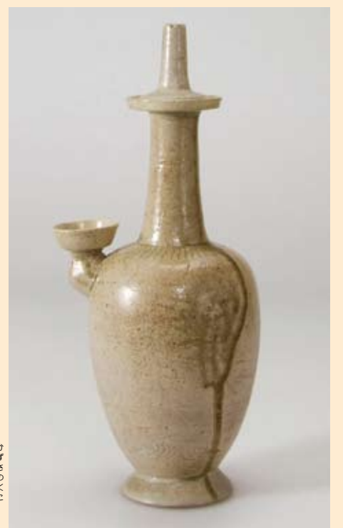
灰釉花紋浄瓶 (市指定文化財、荒久遺跡出土)