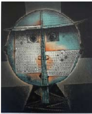
いたずら天使 (深沢幸雄・1992 年作)