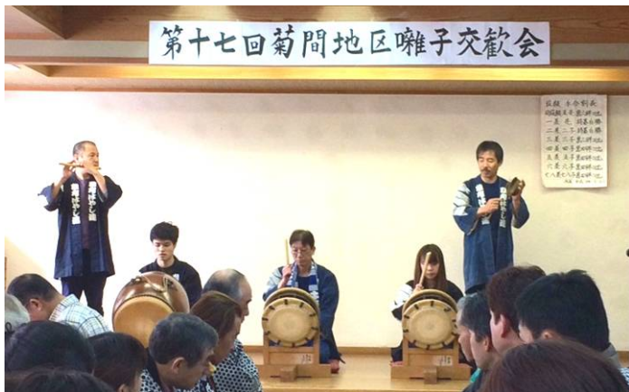
第十七回菊間地区囃子交歓会

茂呂町の町名の由来は、古い資料に室村と表しているものもありますが、詳しいことは分かりません。