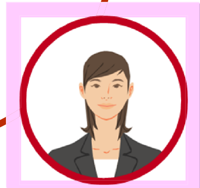
Nhân viên của Hoterasu