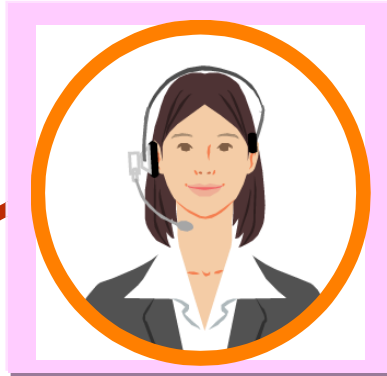
Phiên dịch viên