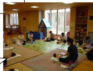
わらべうたサークル