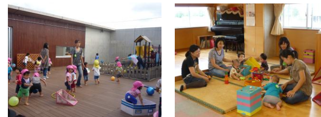
オープンスペース(あさひのお部屋とテラス開放)