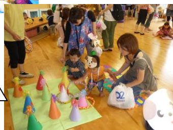
あさひ 主催の 夏祭り