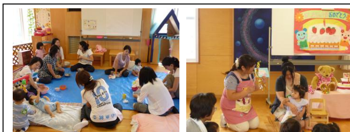
年齢別クラブ(小麦粘土・誕生会)