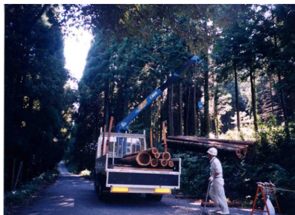
林道より木材を搬出している様子 (林道山口線にて)

本市の林道整備状況については、その殆どが南西部の山間地域に位置している。(表Ⅱ-1)