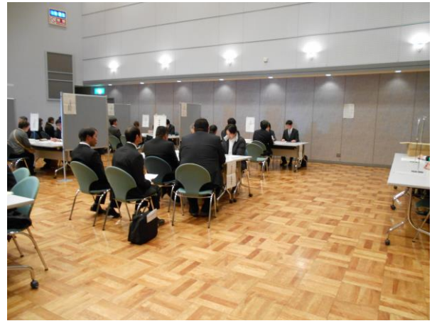
就職面接会の様子