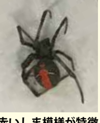
赤いしま模様が特徴

足を除く体長 7 から 10 ミリ、腹部の背面に赤色のしま模様があり、日当たりが良く昆虫などの餌が豊富な花壇の周りやベンチの裏などに生息します。