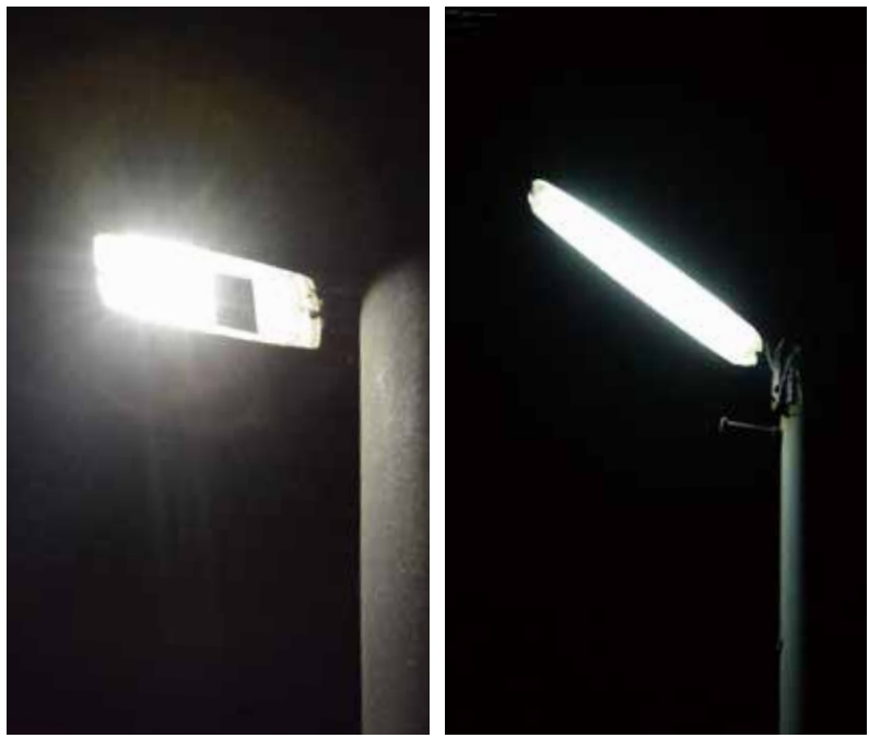
LED灯(写真左)で従来の防犯灯よりも安定した照度

市では、これまで防犯灯のLED化を進めてきましたが、このたび10年間のリース契約を結び、市と町会が管理するおよそ2万灯の防犯灯を、平成30年9月までに一括してLED灯へ交換します。市の管理分は今