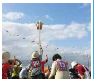
大人も子どもも一緒に大運動会

日時・会場 下表のとおり ※雨天時は体育館などで開催(市原地区は中止。市津地区は10月13日(日)に延期。開催の有無は当日午前7時から音声ガイド(☎ 8686)で確認可)