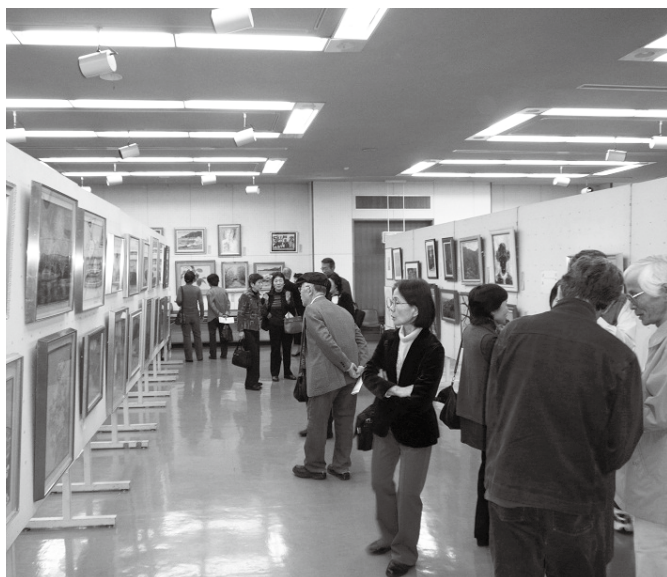
市内の文化団体などが自慢の力作を展示