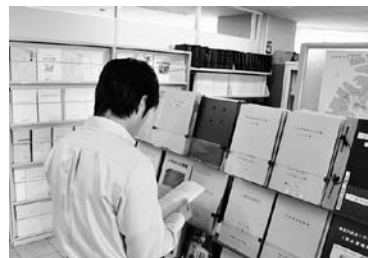
情報公開コーナー(市役所5階)では、各種資料を閲覧することができます

情報公開コーナーで閲覧できます(平成21年4月1日以後開催の会議の議事録などは市ウェブサイトでも閲覧可)。