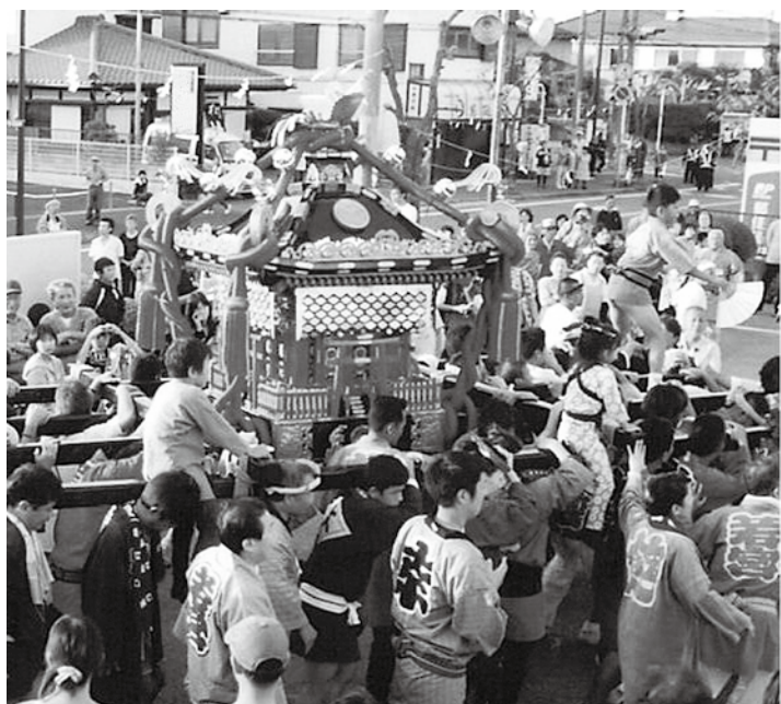
夏祭りなど、地域の連帯づくりも町会・自治会の活動の一つです（写真は若宮団地秋まつり）