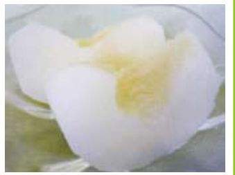
風味豊かな初秋の『豊水』