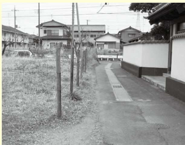
(整備前) 幅 4 m 未満の市道