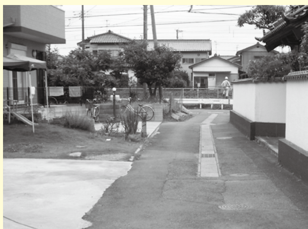
(整備後) 道路の中心から 2 m 後退して家を建築