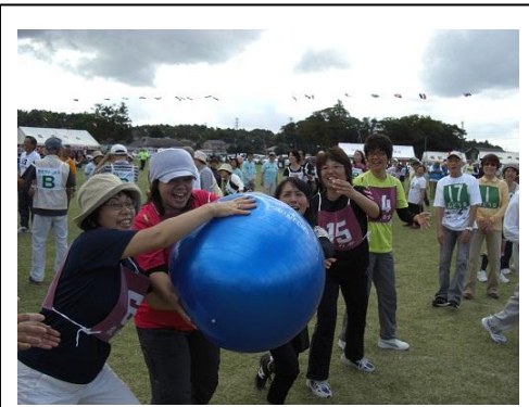
晴天の中の開催(10/14 市津地区)