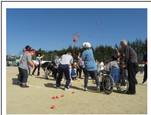
晴天の中の開催(10/6 辰巳台地区)