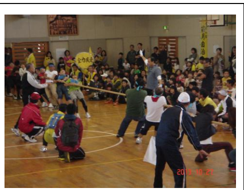
体育館での開催(10/27 ちはら台地区)