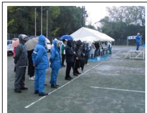
雨の中の開会式(10/20 市原地区)